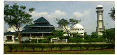
ブキット・インダ・モスク