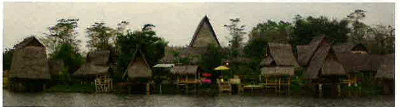
シーフードとスンダ料理レストラン