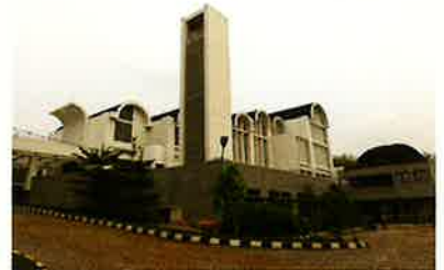
Santa Maria Catholic Church