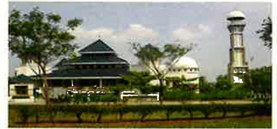
Bukit Indah Grand Mosque