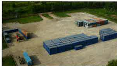
コンテナ・ヤード