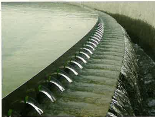
工業用水施設と廃水処理施設