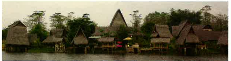
Seafood & Sundanese Restaurants