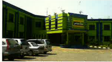
プライム・ビズ・ホテル