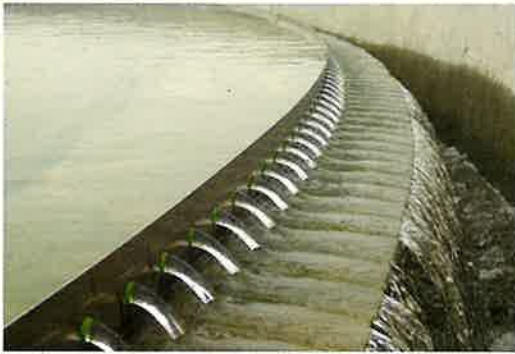
Water Supply & Waste Water