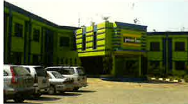
Prime Biz Hotel