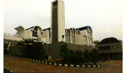
サンタ・マリア・カトリック教会