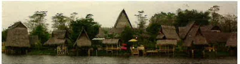
Seafood & Sundanese Restaurants