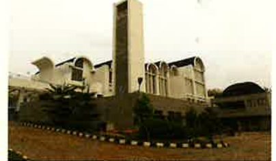
Santa Maria Catholic Church