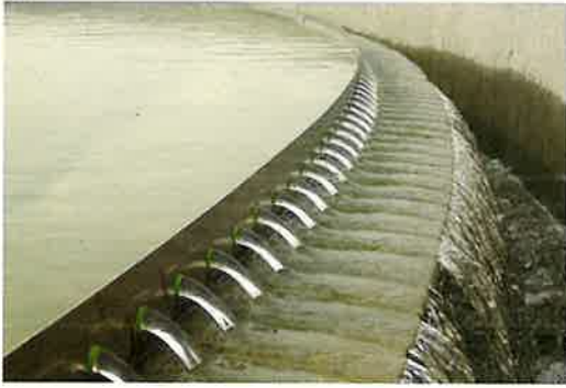
Water Supply & Waste Water