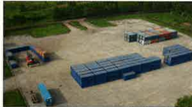
コンテナ・ヤード