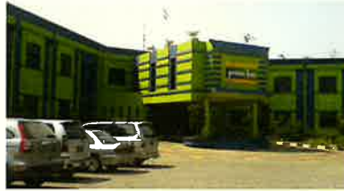
Prime Biz Hotel