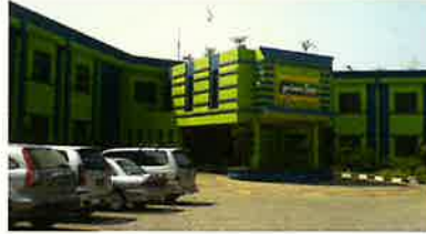
プライム・ビズ・ホテル