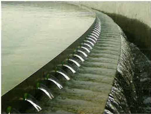
工業用水施設と廃水処理施設