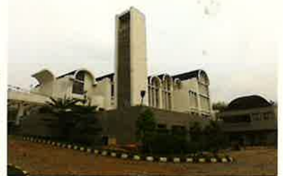
サンタ・マリア・カトリック教会