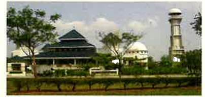
Bukit Indah Grand Mosque