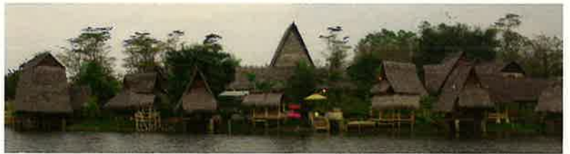
シーフードとスンダ料理レストラン