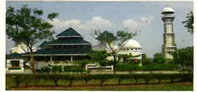
ブキット・インダ・モスク